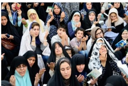
< Iraanse vrouwen die bidden tijdens het vrijdaggebed in de Imamzadeh Moskee, Tajrish plein, Teheran

Voor fotografe Mirjam Terpstra was de trigger voor haar werk met name de kwetsbare vrijheid die zij voelde in Tibet en Iran. De mensen in deze landen vond zij geweldig gastvrij en vooral de kracht van vrouwen sprak haar erg aan.